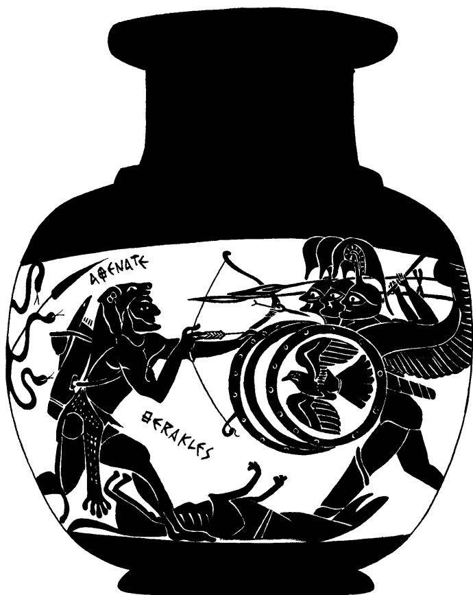
ΚΕΡΑΜΙΚΑ ΔΕ ΦΙΓΥΡΑΣ ΝΕΓΡΑΣ

La unidad sociopolítica del período presocrático es la ciudad arcaica. Allí se mezclan la ciudad y el campo. Es el conjunto constituido por las viviendas, las granjas, el puerto, la acrópolis y la planicie o colina. En materia artística, se destacan los bronce laconianos (que llegan a su apogeo a mediados del siglo VI a. C.), la cerámica de figuras negras y las tragedias de Esquilo.