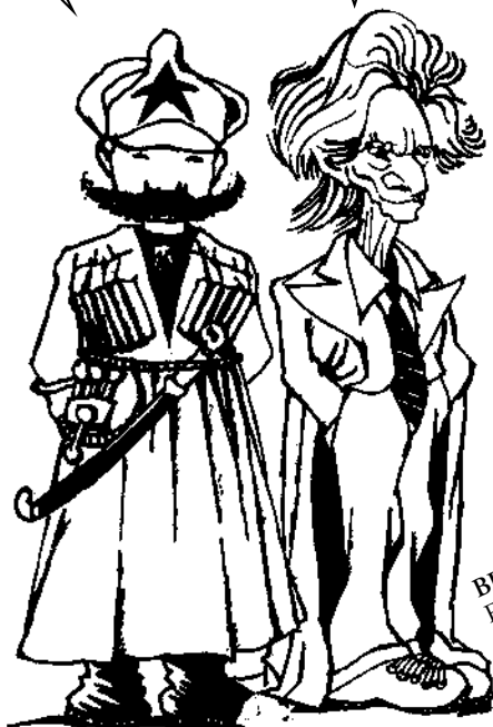
BERTRAND RUSSELL Filósofo británico

... UNA PERSONA IMPORTANTE QUE IGNORABA POR COMPLETO SU PROPIA IMPORTANCIA.